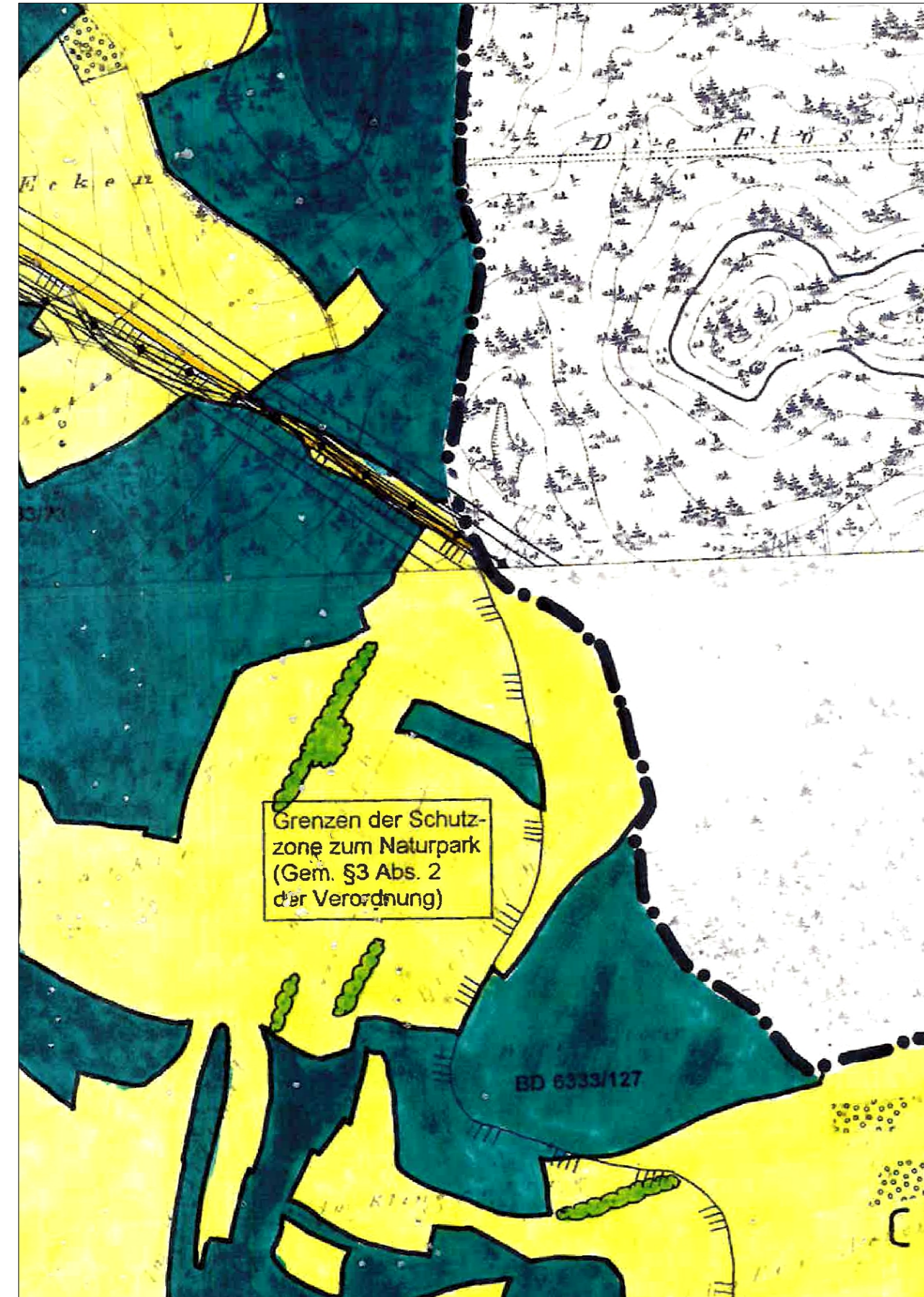
Kartengrundlage: Flächennutzungsplan, digitalisierte Fassung